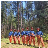
飛騨高山高校 環境科学科3年生