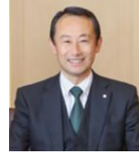
江崎 禎英 岐阜県知事