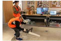
バーチャルチェーンソー