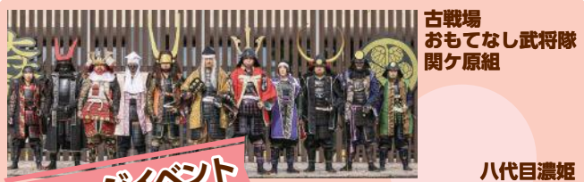
古戦場 おもてなし武将隊 関ヶ原組