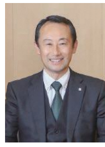
江崎 禎英 岐阜県知事