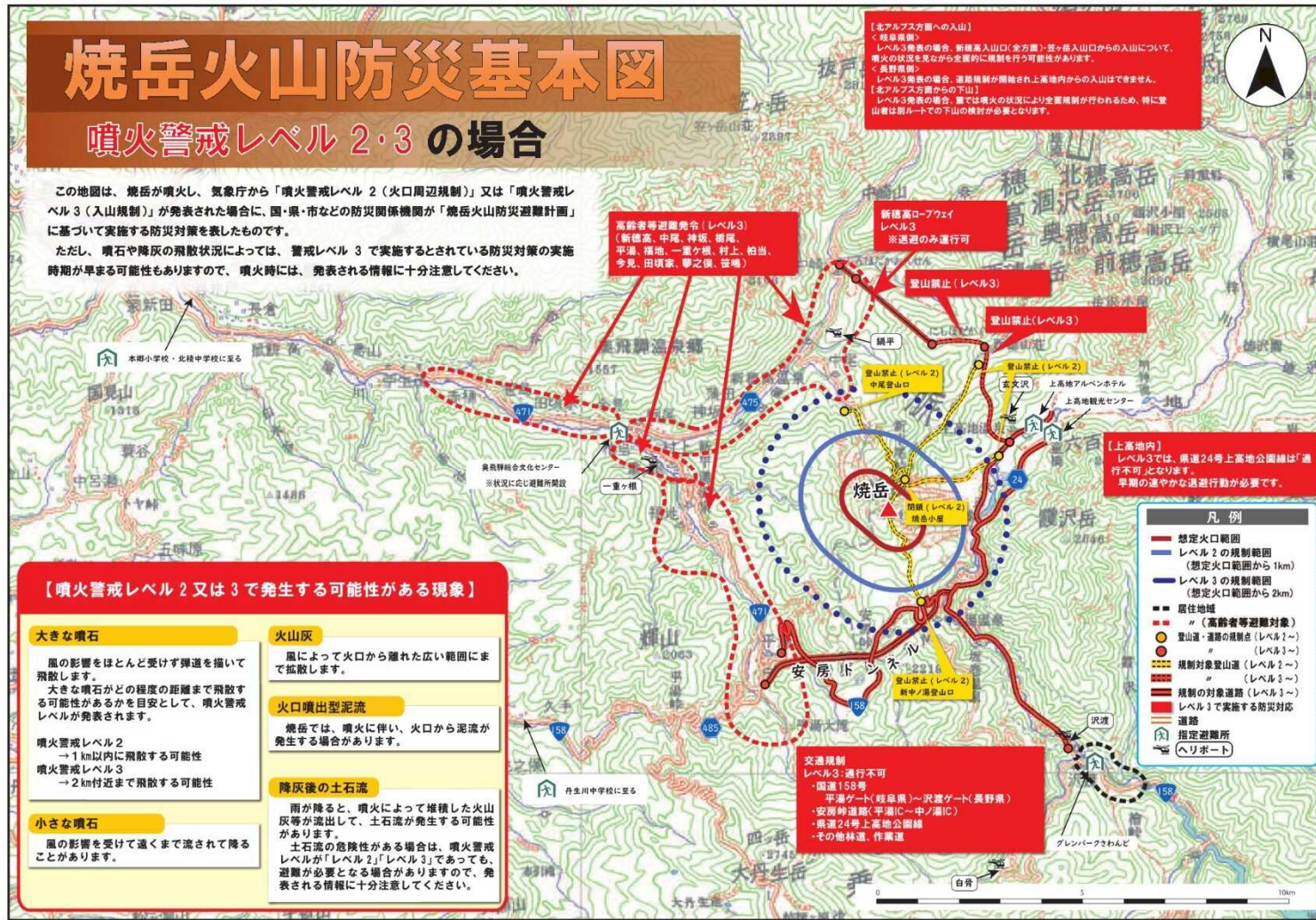
図1 焼岳火山防災基本図(噴火警戒レベル2・3の場合)