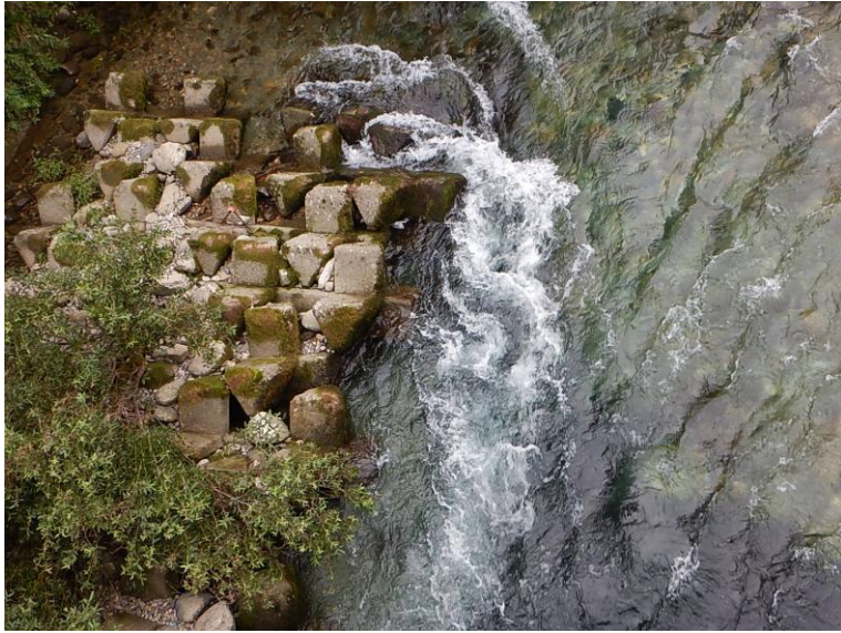
橋上流右岸に設置された護床ブロックの近くでは、複雑な流れが発生しています。絶対に近づかないでください。