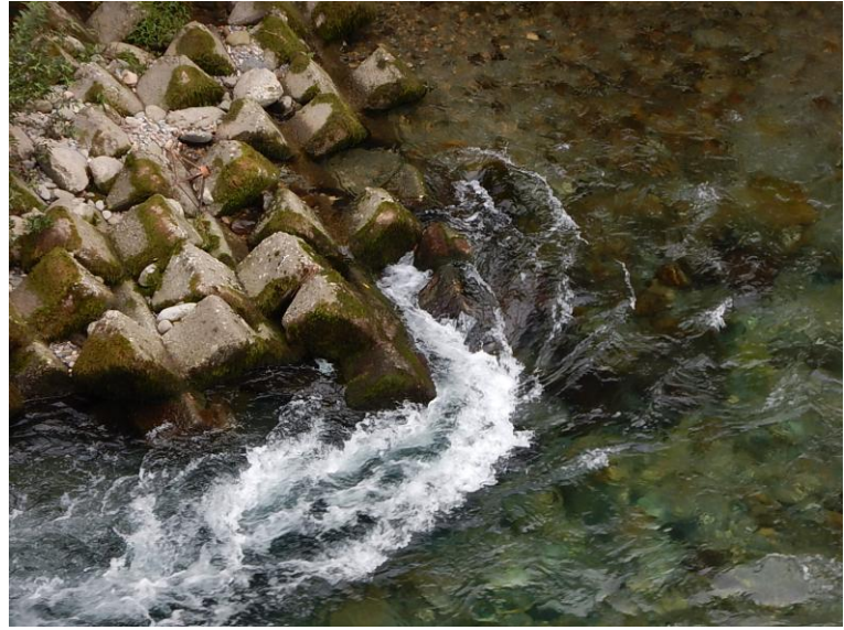
空気が混じって泡立った水の中では、人の体は浮上できず、川底に沈みますので、浅くても溺れることがあります。