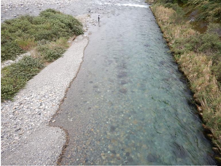
橋の下流右岸。流れの速い流心部が右岸の端にあります。