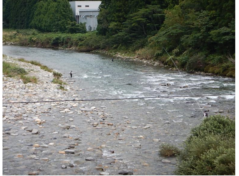
橋の下流。釣り人多数。 水位上昇を察知したら、速やかに川から出てください。