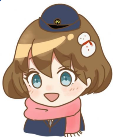
山県警察署公認 マスコットキャラクター がたこちゃん