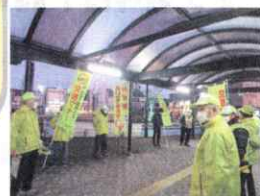
本巣地区交通安全協会