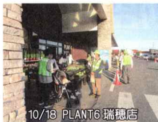
10/18 PLANT6 瑞穂店