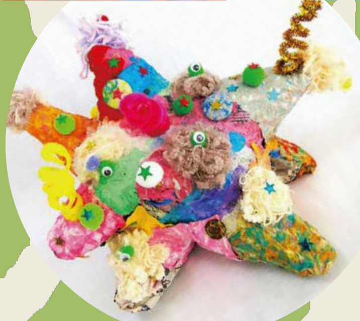
長良特別支援学校

◆発表校 下呂特別支援学校 岐阜本巣特別支援学校 岐阜希望が丘特別支援学校 飛騨吉城特別支援学校(動画発表) 揖斐特別支援学校 恵那特別支援学校(動画発表) 岐阜盲学校