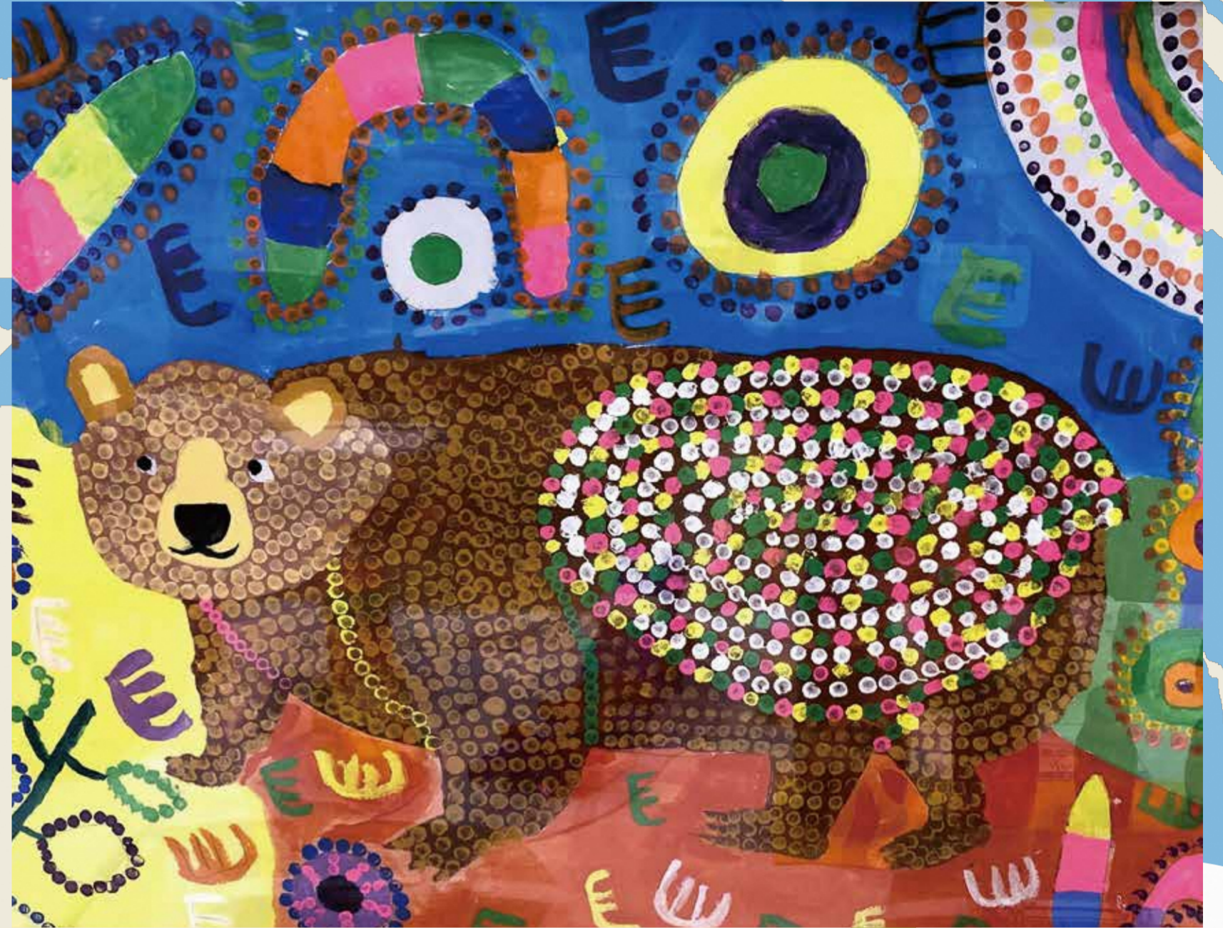
揖斐特別支援学校

県内の特別支援学校23校の作品を一堂に集めました。 学校で学んだことを生かし、考え、工夫しながら制作した作品の数々を ご覧ください。また、各校の作業学習で製作販売している製品も展示。