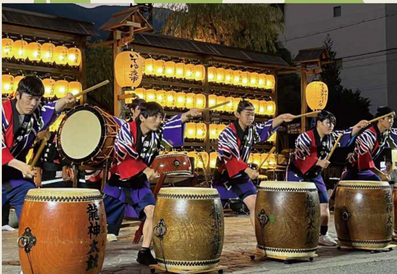
下呂特別支援学校