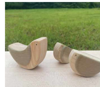
もりのゆらゆら小鳥さん

本体サイズ：大/幅77mm×縦53mm×奥行23mm (30g) 小/幅65mm×縦53mm×奥行23mm (23g) 主な素材：県産材16樹種の木(杉・桧・赤松・唐松・楓・栗・胡桃・ハリギリ・朴・樺・木肌・水楡・榎・ブナ・山桜・ウヰミズザクラ) 種別・用途：積み木