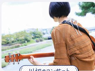
川辺のコンサート