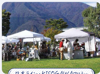
日本ライン・KISOGAWAマルシェ