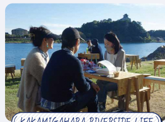
KAKAMIGAHARA RIVERSIDE LIFE