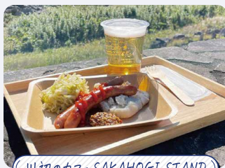
川辺のカフェ SAKAHOGI STAND