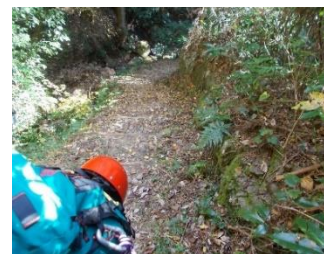
急登・滑りやすい