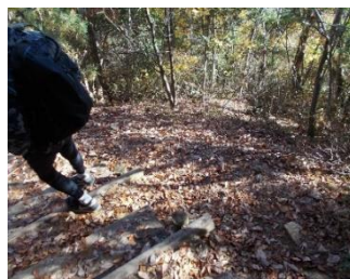
急登・滑りやすい