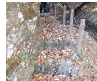
岩の急登・ 雨天時滑りやすい