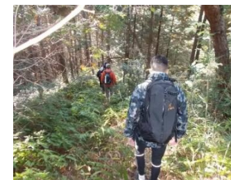
草が茂り、道がわかりづらい