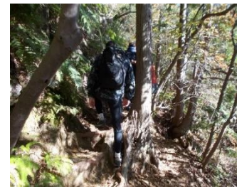
根っこ道・ 足を取られやすい