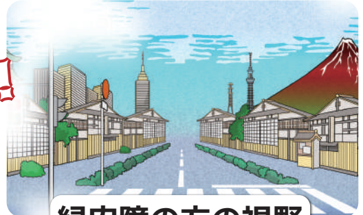
緑内障の方の視野