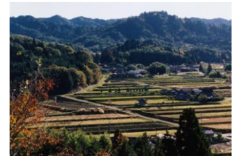
岩村地域 日本一の農村景観