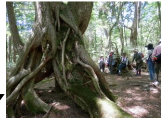
上矢作地域 日本一の原生林