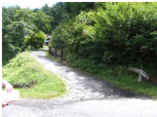
串原地域 日本一のへぼ