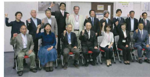
平成30年度入塾式 (岐阜大学サテライトキャンパス)

塾生自らが掲げる防災目標に向け、大学教員等による指導を受け、全県的に防災に携われる防災人材と人的ネットワークの形成を図る