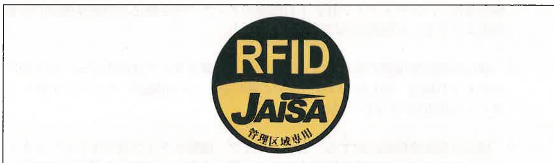
図3 管理区域専用RFID機器用ステッカ

注1： ここでは、公共施設や商業区域などの一般環境下で使用されるRFID機器を対象としており、工場内など一般人が入ることができない管理区域でのみ使用されるRFID機器（管理区域専用RFID機器）については対象外としている。なお、管理区域専用RFID機器については、（一社）日本自動認識システム協会において、一般環境への流出を防止するため、取扱説明書等に注意書きを記載するとともに、管理区域専用RFID機器用ステッカ（図3）を貼付することとされている。