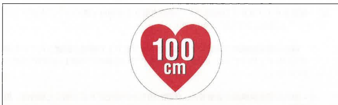
図2 据置きタイプRFID機器（高出力型950MHz帯パッシブタグシステム）用ステッカ

注1： ここでは、公共施設や商業区域などの一般環境下で使用されるRFID機器を対象としており、工場内など一般人が入ることができない管理区域でのみ使用されるRFID機器（管理区域専用RFID機器）については対象外としている。なお、管理区域専用RFID機器については、（一社）日本自動認識システム協会において、一般環境への流出を防止するため、取扱説明書等に注意書きを記載するとともに、管理区域専用RFID機器用ステッカ（図3）を貼付することとされている。