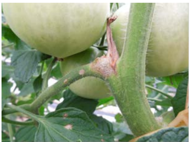
図3 芽かき跡からの発生