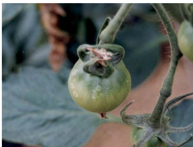
図2 ゴーストスポット発生果