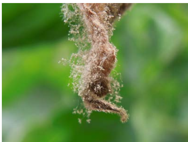
図4 葉先枯れ部に密生する灰色かび病