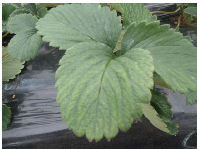
図2 ハダニ類によるかすり葉