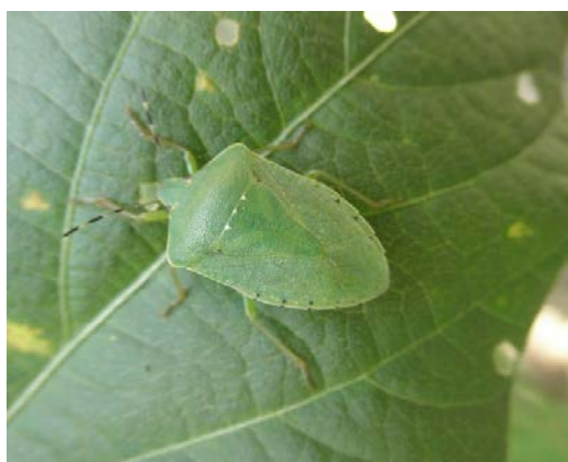
図1 アオクサカメムシ