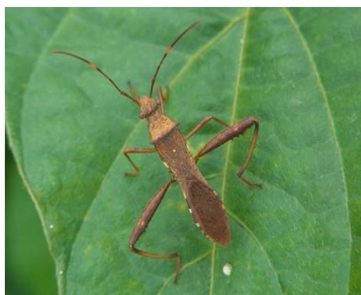
図2 ホソヘリカメムシ