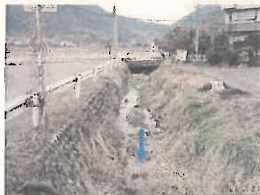
② NO. 97 付近