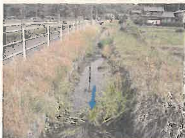
① NO. 85 付近