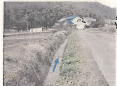
③ NO. 100 付近