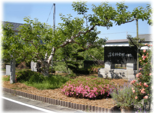
富有柿発祥の地碑と富有の母樹

な な っ っ て て い い た 「居 い 倉 くら 御 ご 所 しよ 」 を を も も と と に に し し て、