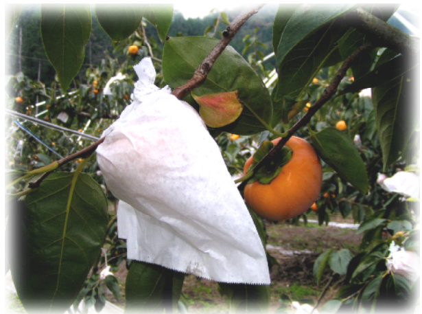
袋の中でじっくり大きくなる果宝柿