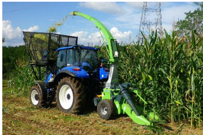
トウモロコシの収穫作業