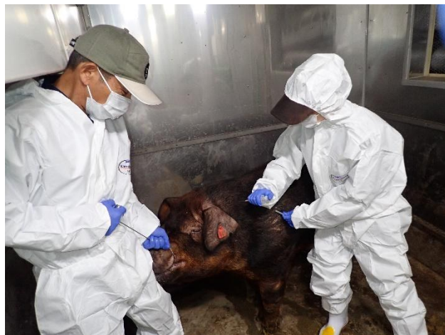
豚の保定（ワクチン接種補助）