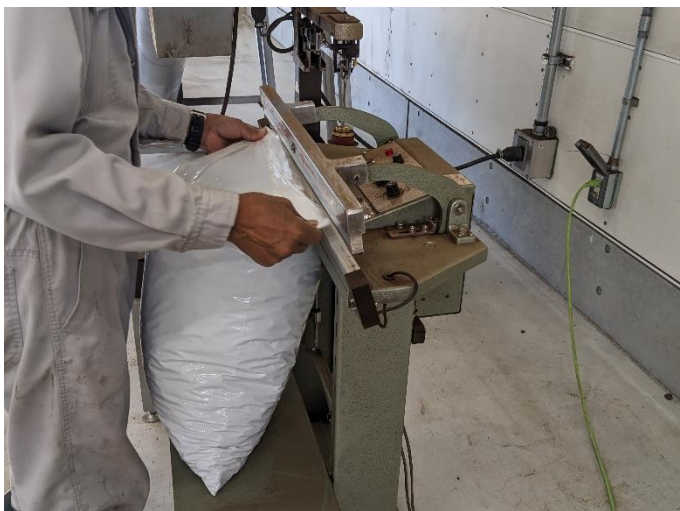
生産堆肥の袋詰め作業