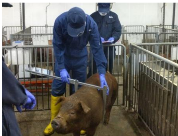
検定風景（超音波画像診断）