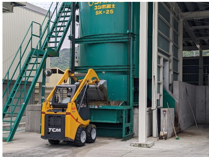
発酵装置への糞尿投入