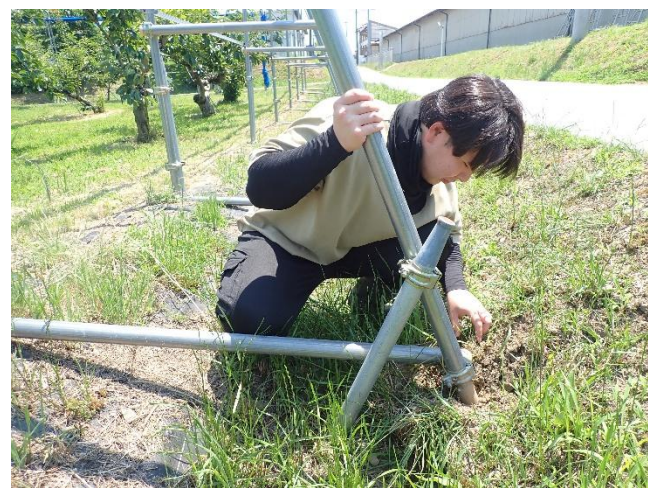
暴風ネットの補修作業