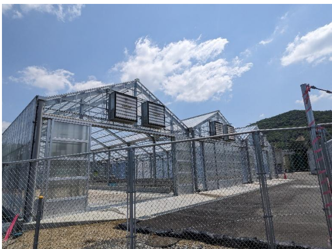
堆肥乾燥ハウス全景