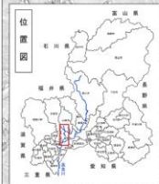
木曽川水系伊自良川洪水浸水想定区域図(浸水継続時間)