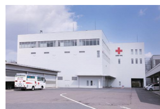
東海北陸ブロック血液センター

岐阜県庁(11時30分発)⇒JR岐阜駅(11時50分発)⇒ 岐阜県赤十字血液センター(岐阜市)見学(12:00~13:30)⇒ 東海北陸ブロック血液センター(愛知県瀬戸市)見学(14:30~15:30)⇒ JR岐阜駅(16時40分着)⇒岐阜県庁(17時着)