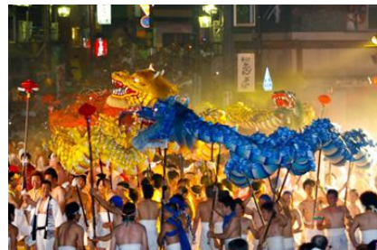
（「恋に効く温泉。」歴代ポスター）