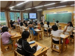
治山事業PR（谷汲小学校）