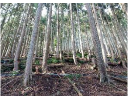
治山事業 本数調整伐（附出）