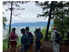
森林サービス産業の活動