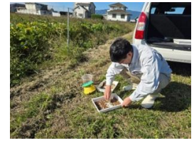
ハスモンヨトウ発生調査