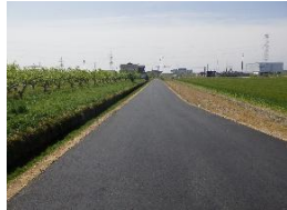
農村振興 農業集落道