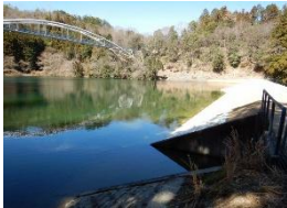
ため池の耐震・豪雨対策