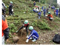
政策オリンピック「安心と共生のニホンザル対策」