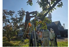
農福連携体験講座（柿）