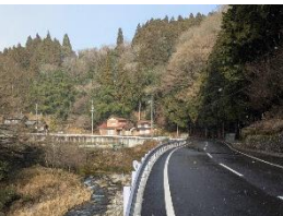
林道 春日・久瀬線