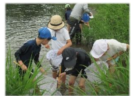
緑と水の子ども会議（北方小学校）