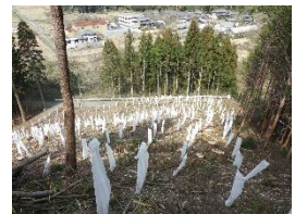
森林整備事業（植栽）