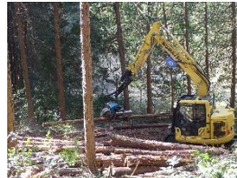
森林整備事業（木材生産）