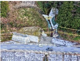
治山事業 溪間工（前平）