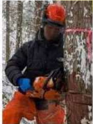
飛騨高山高校 環境科学科 3年生