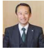
江崎 禎英 岐阜県知事