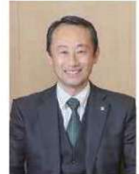
江崎 禎英 岐阜県知事