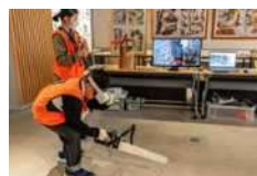
バーチャルチェーンソー