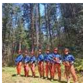
飛騨高山高校 環境科学科3年生