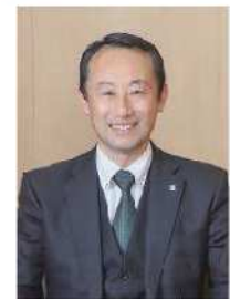
江崎 禎英 岐阜県知事