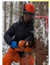
飛騨高山高校 環境科学科 3年生