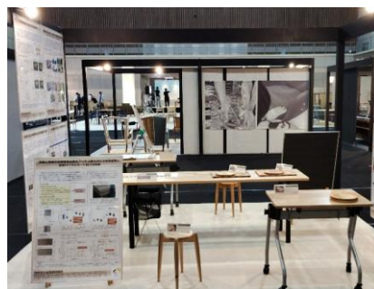
生活技術研究所ブース