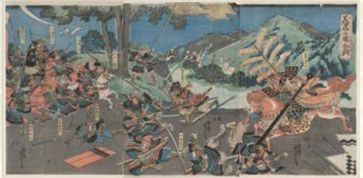
歌川芳虎 美濃の国合戦(当館蔵)