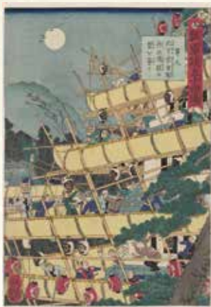
歌川芳艶 瓢箪談五十四場 第九 此下宗吉郎再び須股の砦を築く(当館蔵)