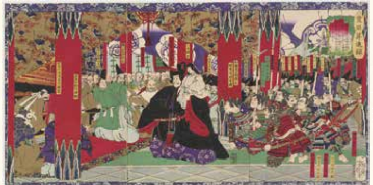
月岡芳年 豊臣昇進録大徳寺(当館蔵)