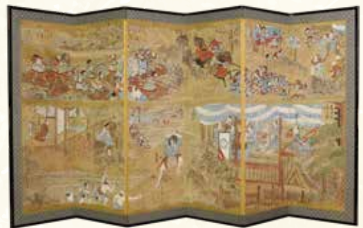
絵本太閤記屏風(個人蔵)