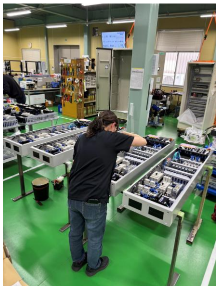
同社の従業員の7割は女性