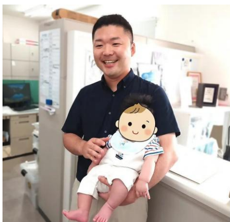
男女ともに育休取得率は100%

同社では、企業が持続的に成長していくためには、社員が安心して働き続けられる環境づくりが不可欠であるとの考えから、働きやすさの向上に向けた取組を進めてきました。