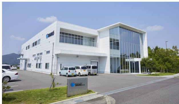
医療、美容・ヘルスケアはじめ多岐にわたる製品・サービスを提供する(株)タナック

岐阜市に本社を置く(株)タナックは、シリコーンをはじめとする多様な素材に関する豊富な知識と高度な配合・加工技術を強みとし、医療、美容・ヘルスケア、ロボット、航空宇宙など、多岐にわたる製品やサービスを提供しています。