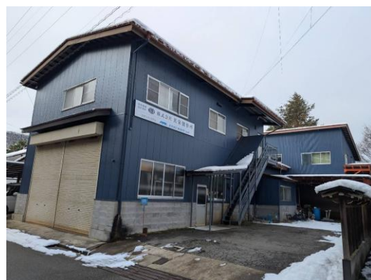
高山市内で産業用省力機械などを設計製作する (株)共栄製作所

高山市で産業用省力化機械などを設計製作する(株)共栄製作所では、営業担当者が企業のニーズを丁寧にヒアリングし、企画設計から部品加工、組み立て、電気プログラムやソフトウェアの構築までを一貫して自社で担っています。企業からの要望に細やかに対応した機械をオーダーメイドで設計製作できることが強みです。