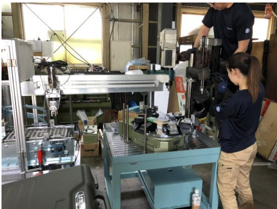
電気プログラムの設計を担う女性従業員

この女性従業員は当時、妊娠出産時期と重なったこともあり、最初は時短勤務や出張免除、在宅勤務などを組み合わせたほか、体調なども考慮して、重いものを持たなくても座ってできる、また在宅でもできる電気プログラムの構築を任せたとのことです。