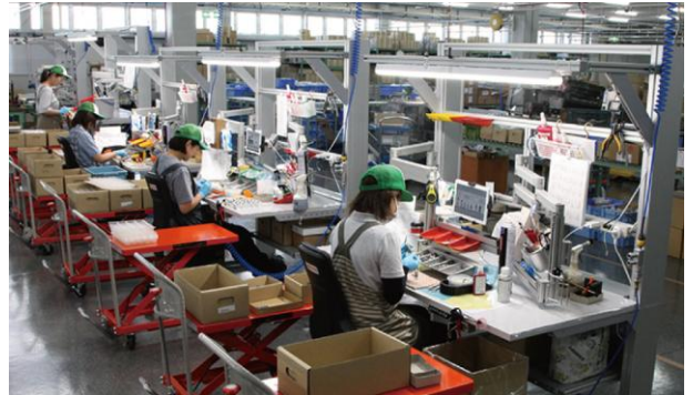
製造現場でも女性が多く活躍

こうした取組を通じて寄せられた声を基に、小学校卒業までの児童の養育や自身の療養、介護などの事情により、連続して3年間利用できる「時短勤務」制度や、障がいや疾病などの事情に応じて、終期を定めずに勤務時間を最大2時間短縮できる「短時間正社員制度」などを実現しました。