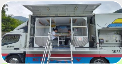
地震体験車で震度7を体験!