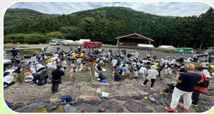
マスのつかみとり♪♪