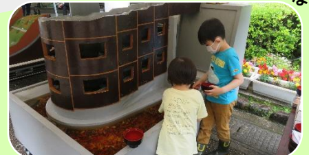
魚道模型&金魚すくい♪♪