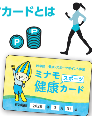
※画面はイメージです