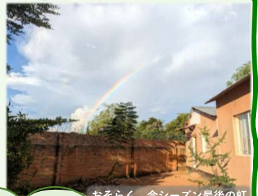
おそらく、今シーズン最後の虹

岐阜県の皆さん、こんにちは！日本は初夏を迎え、新緑が美しい季節でしょうか。こちらザンビアは乾季が始まり、日常生活で雨の心配をする必要がなくなりました。さて第12回は、1年目の振り返りとして、ザンビア生活で印象的だったことを紹介します。日本とは異なる環境の中で感じた、日々の驚きや楽しさ、そして面白さ。大きなことから小さなことまで、数あるエピソードからいくつかお届けします！