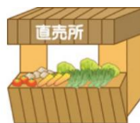
直売所で 余ったもの