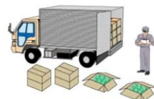
輸送段階で 箱が傷んだもの