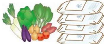
余剰生産 (一時的でも可能)