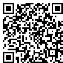
<県公式HPオンライン納付>