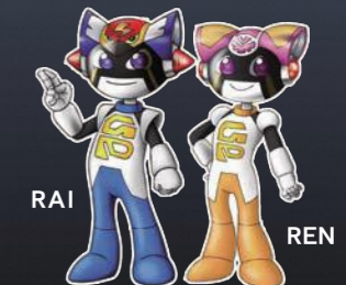
岐阜県警察シンボルマスコット