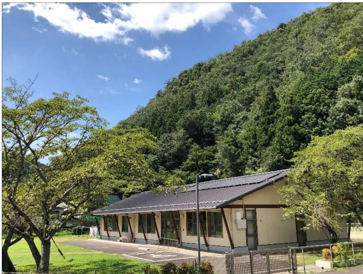
動物愛護センター外観

※ 動物愛護センター職員は、野生鳥獣リハビリセンターを主管する環境エネルギー生活部環境生活政策課を兼務