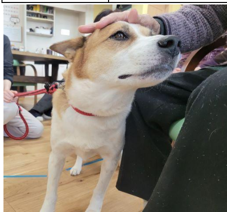
セラピー犬 (ももえ)