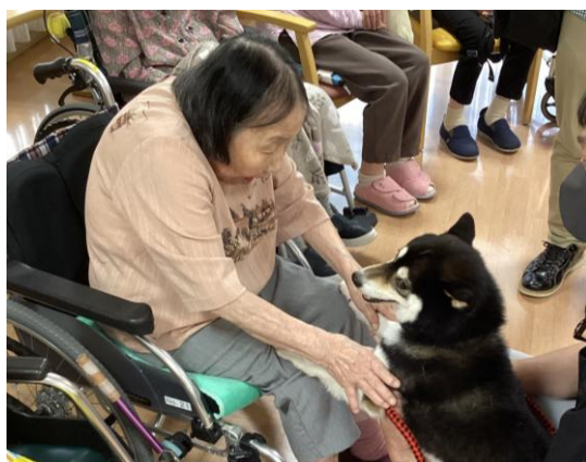
動物介在活動の様子