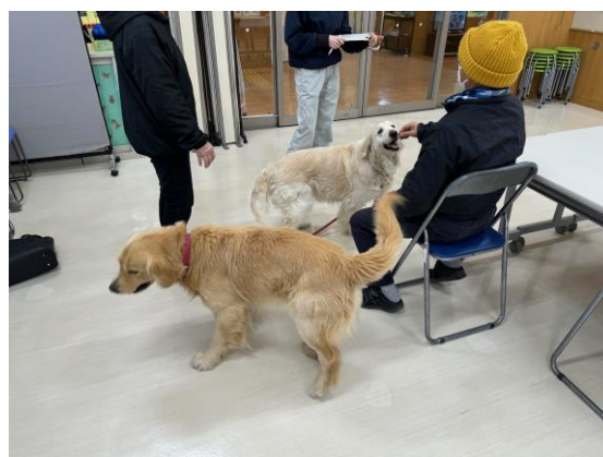
犬の飼い方・しつけ方個別相談の様子