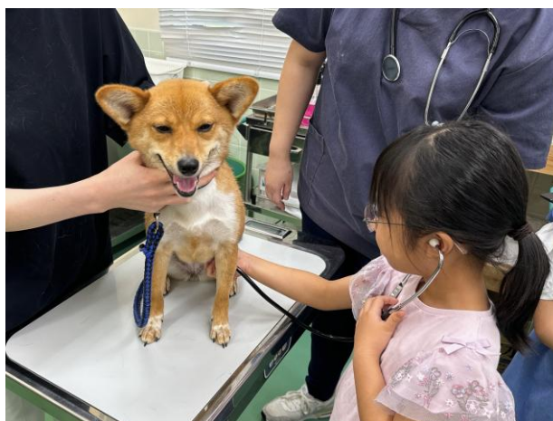
獣医師のお仕事体験教室の様子