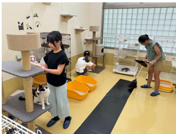
動物愛護センターのお仕事体験教室の様子