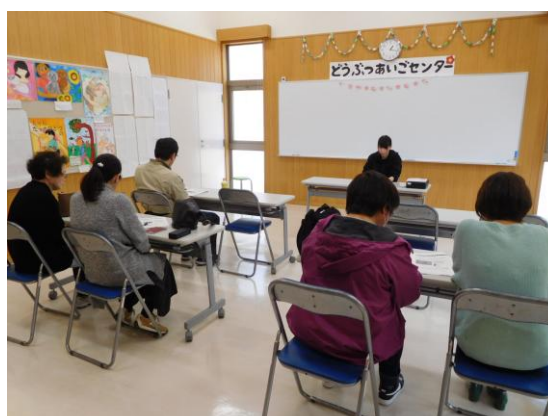
譲渡前講習会の様子