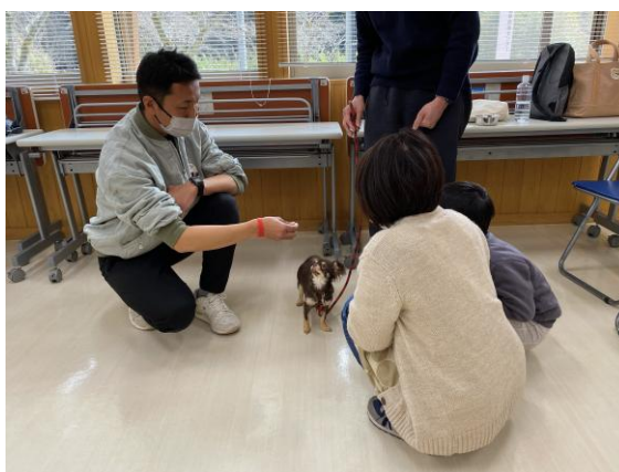
しつけ方教室の様子