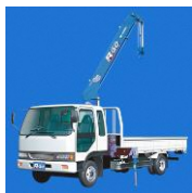
小型移動式クレーン