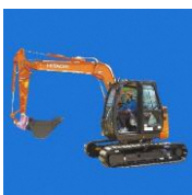
車両系建設機械(整地等)