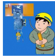
床上操作式クレーン