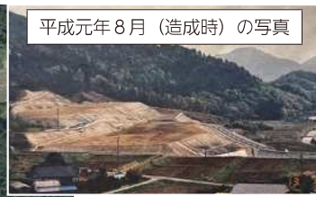
平成元年8月（造成時）の写真