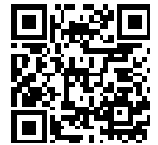
とみばん家 QR コード

右記の QR コードより申し込み申請を行ってください。申請を確認後、役場よりお母さんへ連絡させていただきます。(実施日は裏面を参照してください。)