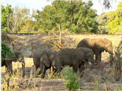
(上) 線路のそばに現れたゾウの群れ (下) 野生動物の看板