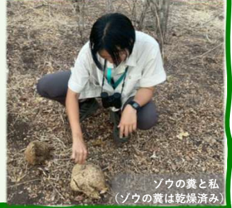
ゾウの糞と私 (ゾウの糞は乾燥済み)

岐阜県の皆さん、こんにちは！日本は、冬を終えて春の温かさを感じる頃でしょうか。こちらザンビアは、雨季の終盤を迎え、市場は野菜や果物でにぎわっています。さて第10回は、 ザンビアの国立公園 について紹介します。ザンビアに来たからには、ぜひ行ってみたいと思っていた場所の一つがサファリです。まるで別世界のような雄大な自然と、野生動物たちの世界を、ぜひお楽しみください。