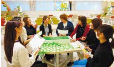
社員全員のエンゲージメント向上を目指す「エンゲージメント推進チーム」。セミナー開催や産休育休制度を分かりやすく社員に共有するなど活動は多岐に渡る。社員が集う2F Museumホールは、リノベーションによりさらに快適な空間へ。