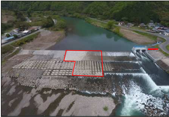
下流から上流を望む