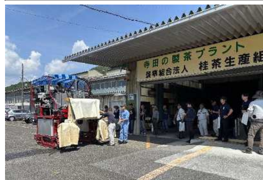
・茶栽培における省力化技術の活用研修（8/22）