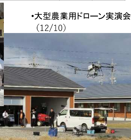
・大型農業用ドローン実演会（12/10）