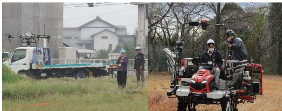
ドローンの操作 第2回研修会（10/11）