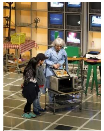
サイエンスショー