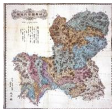
岐阜県管内地図 (所蔵地図より)

日本及び世界 180 余りの国や地域の地図や、古地図等、約 16 万点の地図及び関連資料を所蔵しています。これらを活用して、飛山濃水と呼ばれる岐阜県の地域的・文化的特色の比較や、地域の成り立ちと発展・変容等を学ぶことができます。地図収蔵庫の見学や地図の特別貸出もできます。当館 HP「授業で使える当館所蔵地図」もご活用ください。