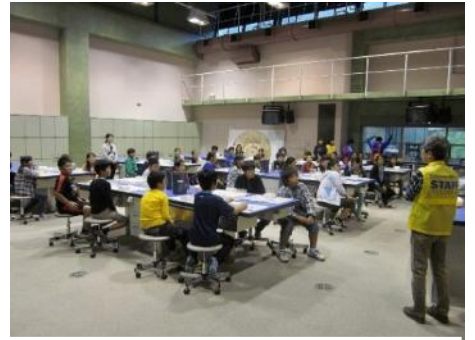
サイエンスワークショップ

サイエンスワールドに来館できない県内の小学校・中学校・特別支援学校向けに、当館職員が学校に出向き、実験ショーや科学実験・工作を行う出前授業です。4月～6月、9月～3月に実施します。