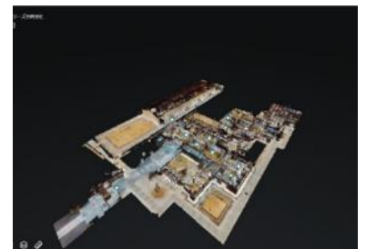
ドールハウス (3Dモデル)

ドローンで撮影した映像を公開しており、通常は見るできない視点から、高山陣屋を見ることができます。