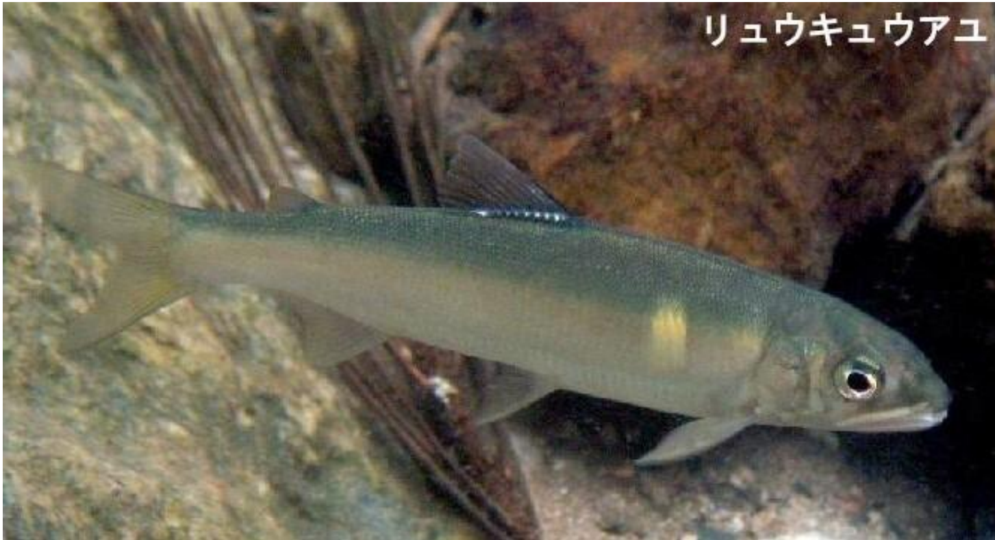
リュウキュウアユ