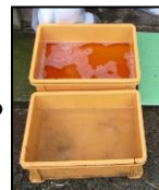
推奨される踏込消毒槽の設置方法！