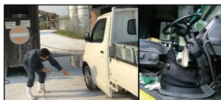
車両はタイヤだけでなく、 泥よけの内側まで消毒し、フロアマットの交換やペダル等車内も消毒