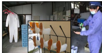
専用の服や靴の使用、手指消毒