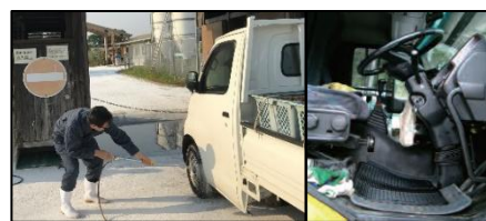
車両はタイヤだけでなく、 泥よけの内側まで消毒 し、 フロアマットの交換やペダル等車内も消毒