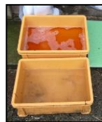
推奨される踏込消毒槽の設置方法