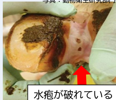
水疱が破れている